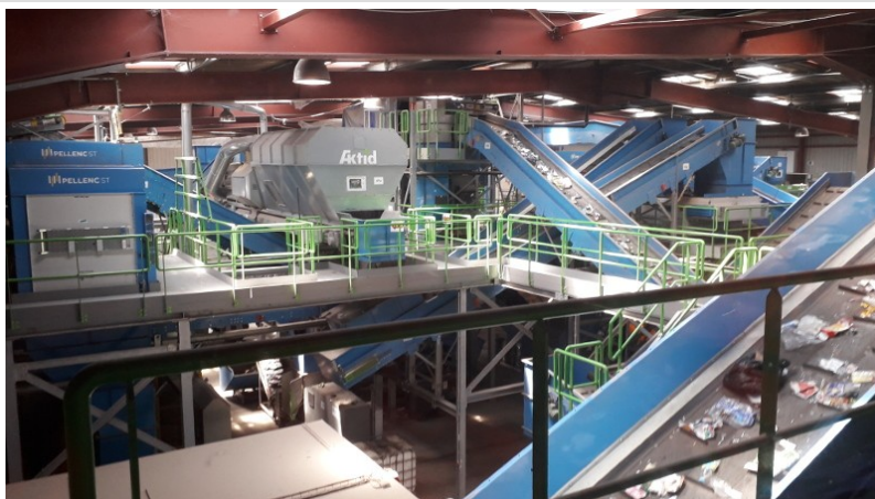
Centre de tri adapté aux nouvelles consignes avec son parcours ludo-pédagogique « tri aventure »